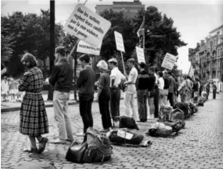
La marche contre les armes nucléaires de San Francisco à Moscou (1960-1961) était organisée par le Committee for Nonviolent Action. Elle transitait par la Grande-Bretagne, la France, l'Allemagne, la Pologne, la Russie...