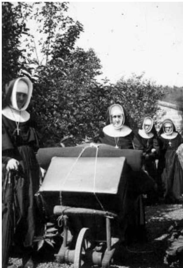
Religieuses sur les routes de l'exode entre Huy et Namur le 13 mai 1940. (CEGES, Collection Bernard) Kloosterzusters op de vlucht, ergens tussen Hoei en Namen, 13 mei 1940. (SOMA, Collectie Bernard)

- Par l'entremise de notre correspondant, Jacques Wynants, nous avons pu digitaliser diverses collections portant sur la région de Verviers: une importante série sur la drôle de guerre, la capitulation et la libération de Comblain-au-Pont (182 photos, collection Bernard); des clichés sur la présence à Verviers du 77th hôpital d'évacuation américain (17 photos) et la libération de Verviers (5 photos, collection Philippart). / Via Jacques Wynants konden we een aantal collecties inzake Verviers digitaliseren. De collectie Bernard (182 foto's) betreft de schemeroorlog, de kapitulatie en bevrijding van Comblain-au-Pont. De collectie Philippart (5 foto's) betreft de bevrijding van Verviers. Tevens zijn er 17 foto's over het verblijf van het 77ste Amerikaans veldhospitaal in Verviers.