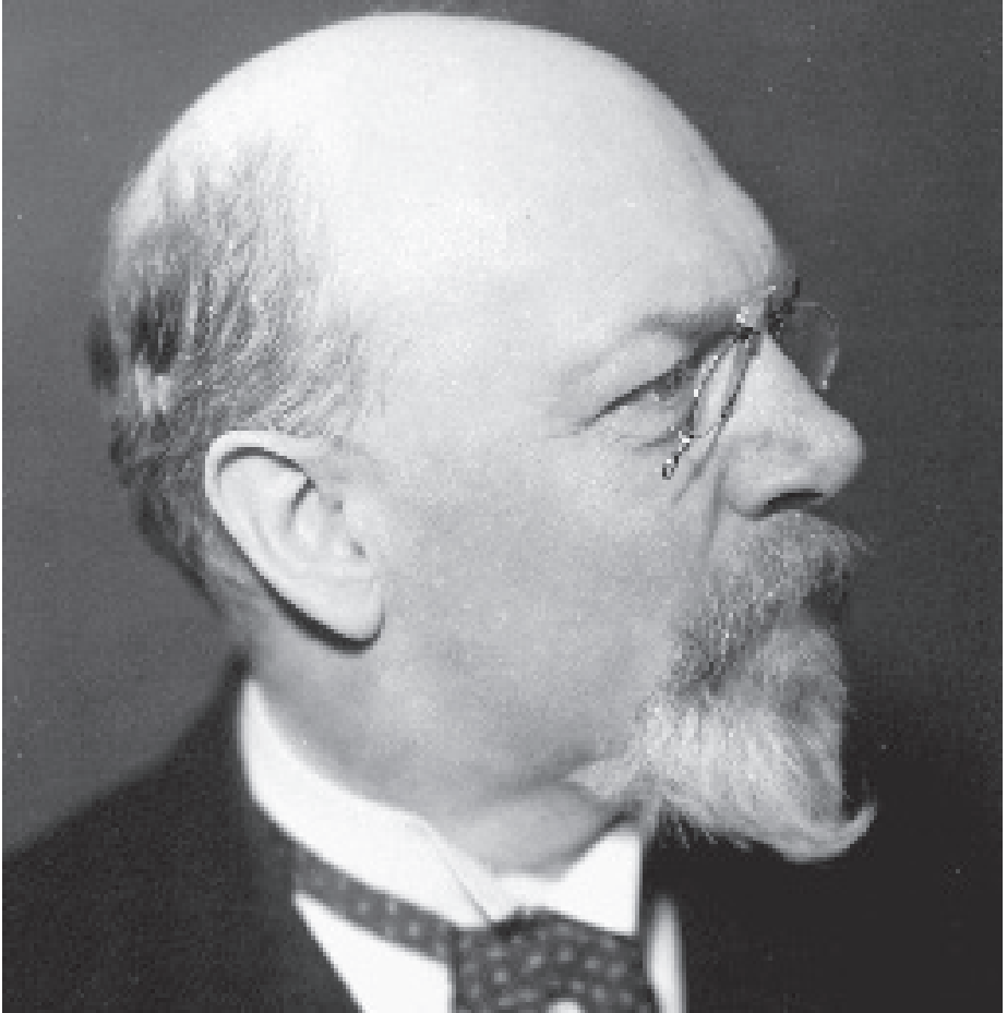
• August Borms, medestichter en voorman van de Raad van Vlaanderen.

groot-historische kans verkeken, dan blijven er daar 250 /300.000 stamgenoten een zedelijk-kwijnend plantenleven leiden, om allicht door geestelijk-Vlaams uitsterven ten slotte stilaan voor de Groot-Nederlandse familie verloren te gaan”. Het vraagstuk moest aangekaart worden op de komende vredesonderhandelingen. Zijn slotroep luidde : Flandria irredenta 12 .