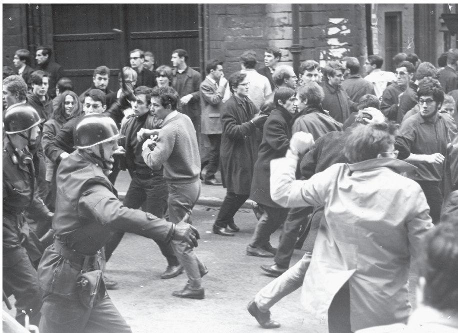
• Studentenprotest in de straten van Leuven, december 1966.

De evolutie die de VVS uitging, was heel wat geëngageerde studenten een doorn in het oog. De MLB was echter een te duchten tegenstander, waar ongeorganiseerde studenten niet tegenop konden boksen. Vooral in het 'rode' Leuven kon de MLB op een grote achterban rekenen. Het initiatief voor het 'verzet' kwam van de Socialistische Jonge Wacht (SJW), die in zich 1964 van de BSP had afgescheurd om een trotskistische koers te gaan varen, en die sedert het begin van de jaren zeventig de voornaamste concurrent was van de MLB in de strijd om de ziertjes van de progressieve studenten. De SJW wilde van de VVS opnieuw een dynamische vereniging maken, met facultaire basisgroepen en open congressen die echte discussiefora van de progressieve Vlaamse studentenbeweging zouden zijn. Omdat de SJW niet sterk genoeg was om het helemaal alleen tegen de MLB op te nemen, sloot zij een verbond met het Centrum voor Vorming en Actie (CVA). Het CVA was in juni 1973 ontstaan door een fusie van het door haar moederorganisatie