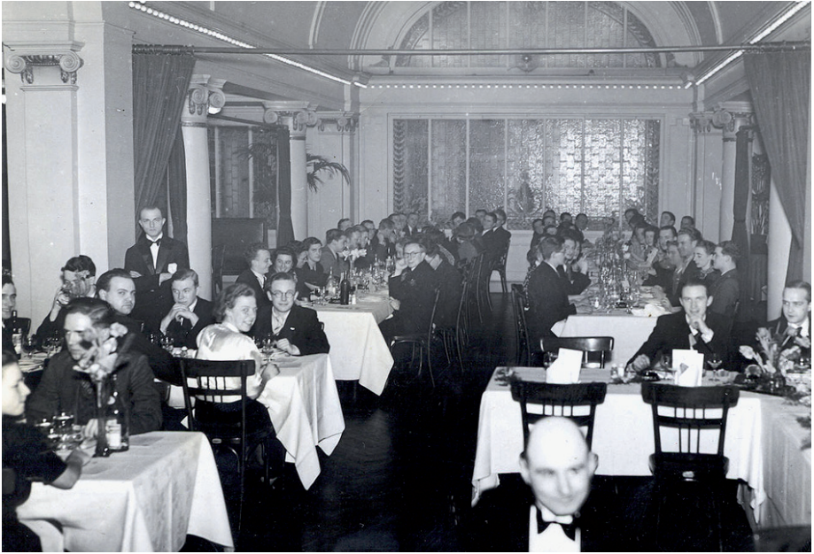
• Eerste congres van de Vereniging van Vlaamse Studenten: afsluitend banket. Gent, Posthotel, 18 februari 1939.