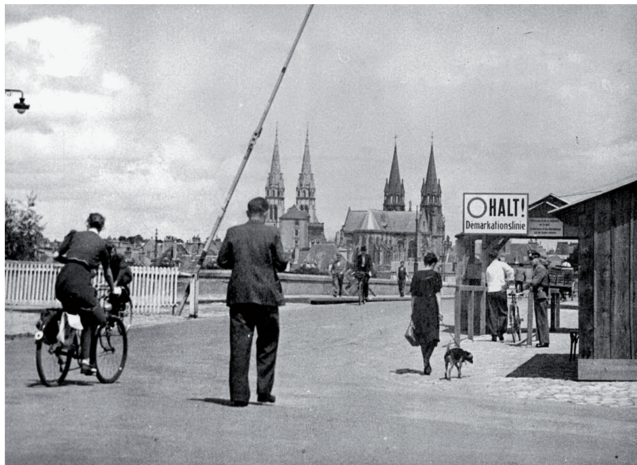
• De demarcatielijn bij de stad Moulins.