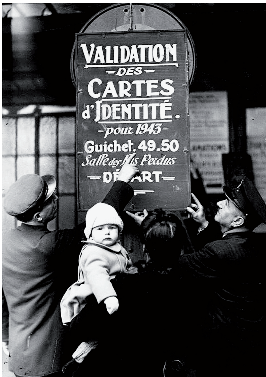
• In het station van Lyon worden pancartes aangebracht voor reizigers die de demarcatielijn willen oversteken.