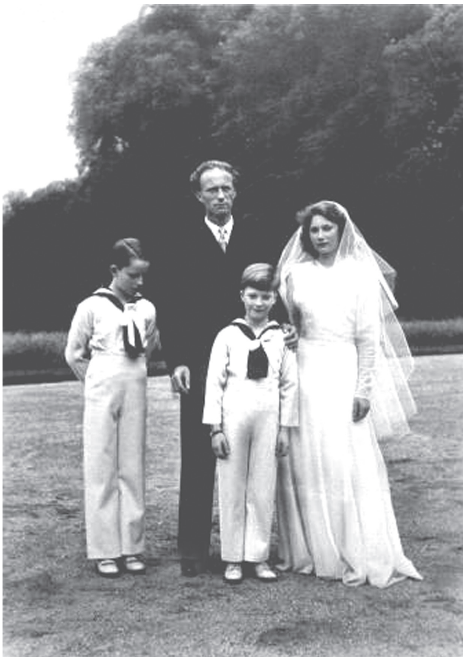
• Léopold III entouré de Baudouin, Albert et Joséphine-Charlotte, dans le parc de Laeken, décembre 1941.