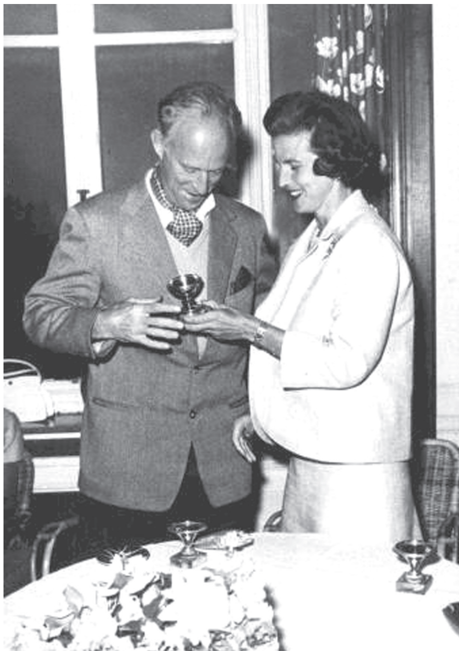
• Le roi Léopold III et la princesse Lilian pendant les années soixante.