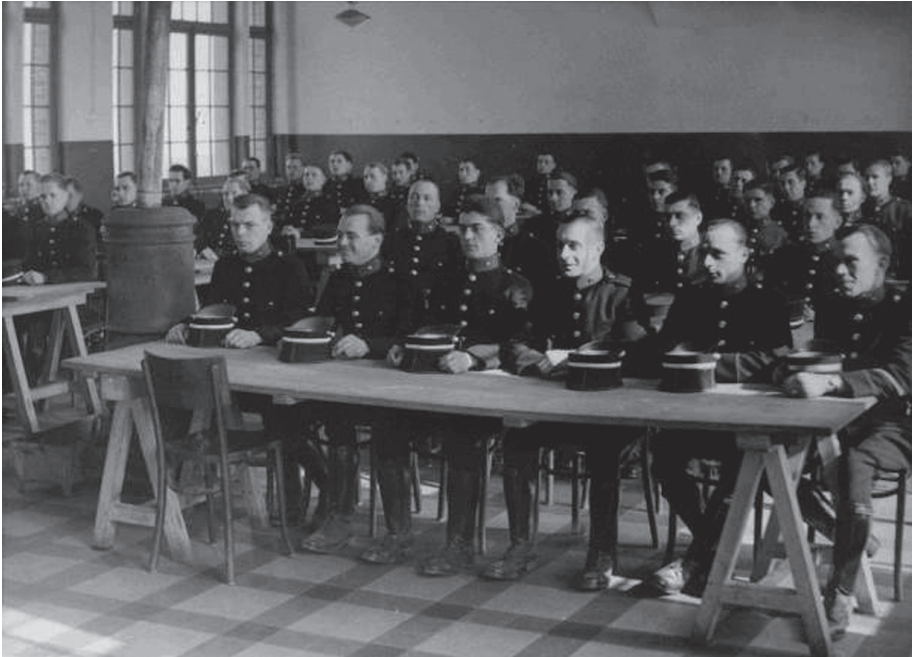
• Le renforcement de la gendarmerie sous l'Occupation : une classe au centre de formation de la gendarmerie de Vottem.