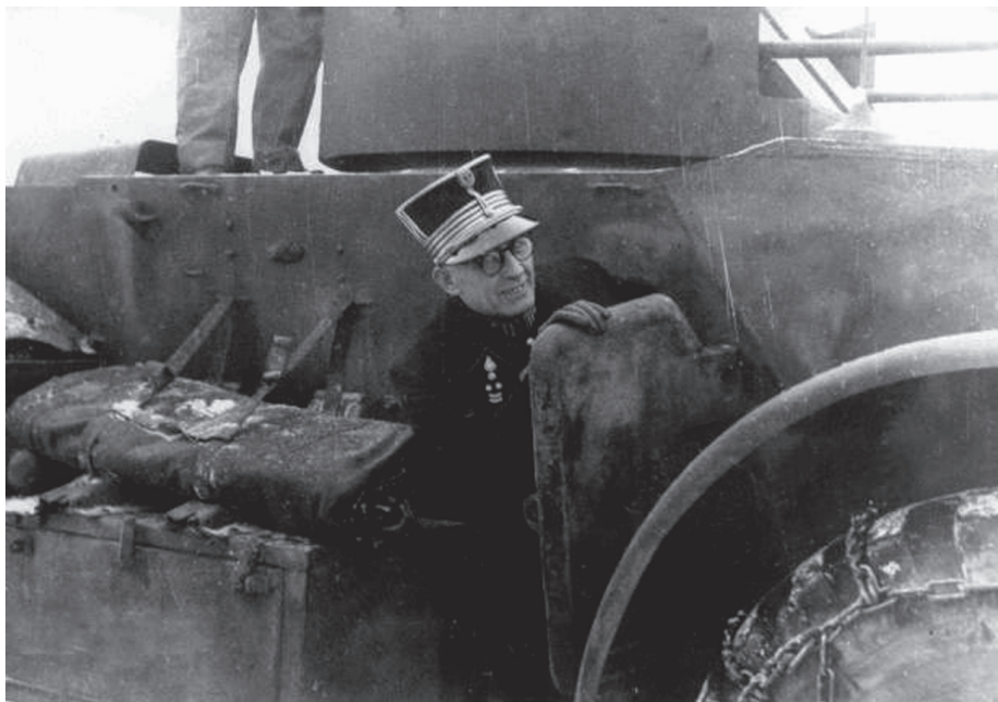
• Remise de chars à la gendarmerie en présence d'un officier supérieur, hiver 1944-1945.

la gendarmerie. À cette date, il y aurait “2 condamnations par une juridiction militaire, 9 pensions d’office, 1 punition disciplinaire et 24 dossiers toujours en instance” pour le cadre des officiers, ainsi que “2 condamnations par une juridiction militaire, 34 sanctions administratives, 36 exclusions du corps, 57 punitions disciplinaires, 52 résiliations d’engagement, 27 pensions d’office et 175 dossiers toujours en cours” 26 parmi les sous-officiers et gendarmes. Selon ces chiffres, 36 officiers sont concernés par des mesures disciplinaires, soit 20,57 % du cadre de 1940 ou 14,4 % de celui de l’Occupation. Pour les sous-officiers, il y aurait eu un total de 383 gendarmes poursuivis entre la Libération et le mois de décembre 1946, soit environ 4,6 % des gendarmes de 1940 ou 3,7 % du cadre renforcé.