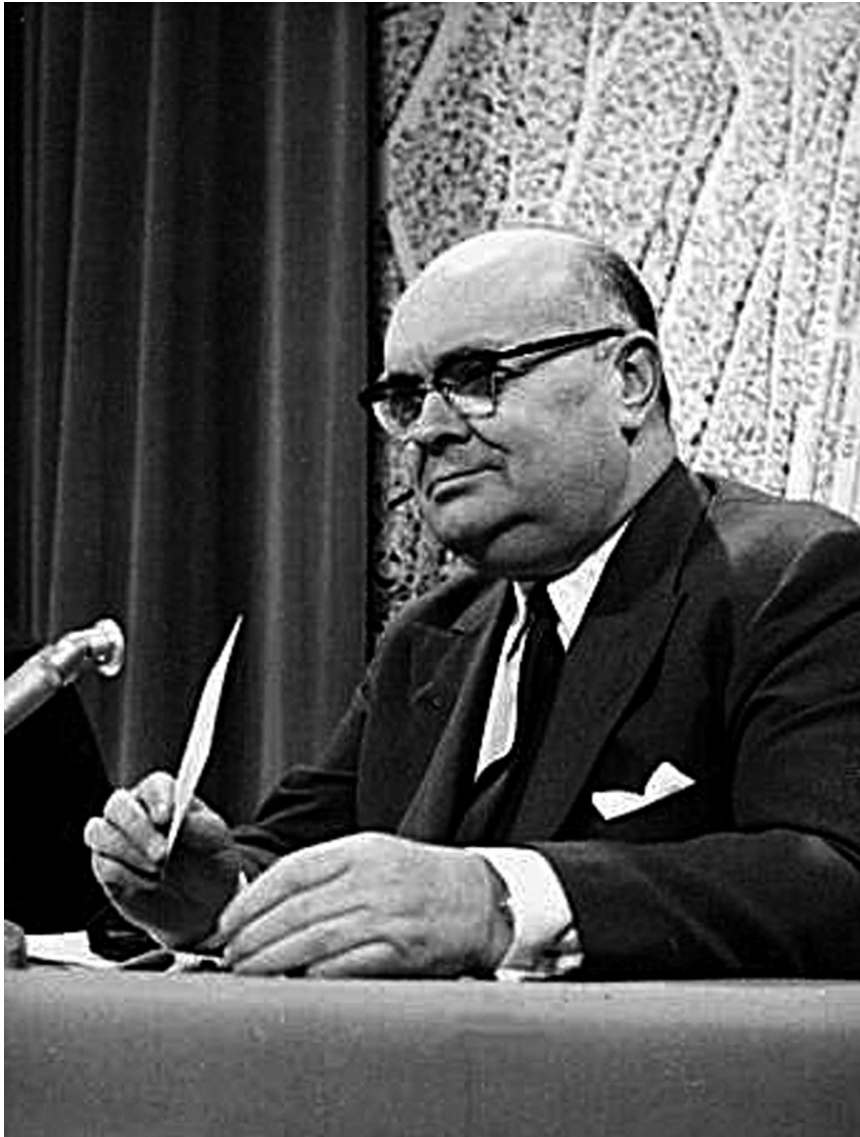
• Paul-Henri Spaak als secretaris-generaal van de NATO in de late jaren 1950.

liep de Gruben bovendien vooruit op de katholieke politici en denkers die tijdens de oorlog in Groot-Brittannië of de Verenigde Staten in ballingschap waren. In hun debatten en publicaties schonken ze weinig aandacht aan de specifieke idee van een federale ordening van Europa. Wanneer katholieke politici het federalisme verdedigden,