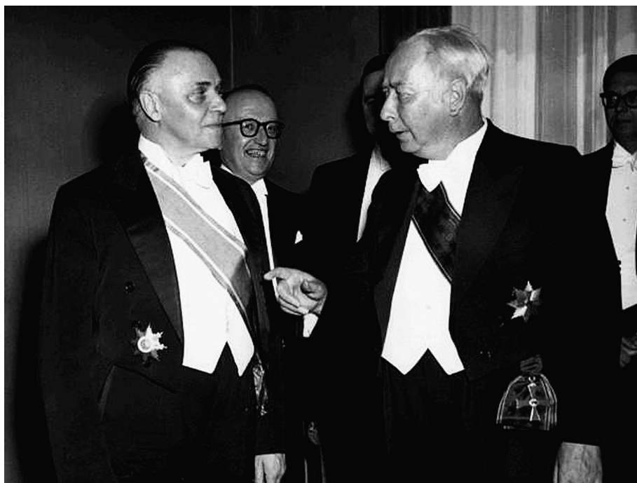
• Hervé de Gruben als Belgisch ambassadeur in Bonn (links) naast de Duitse president Theodor Heuss, midden jaren 1950.

vertoog viseerde specifiek het Lutherse Pruisen, dat verondersteld werd een catastrofale invloed te hebben uitgeoefend op de Duitse geschiedenis 127 .