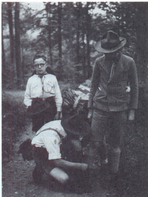
• Een scoutspatrouille op pad eind de jaren dertig.