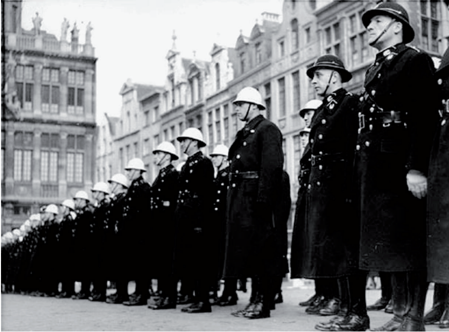
• Parade de la police de Bruxelles sur la grand-place, 1943.

Traversière 6. J'ai répondu au Dr Thomas qu'un jour la police belge avait été engagée dans une opération semblable – arrestation d'ex-prisonniers et d'otages belges – et que depuis lors le Bourgmestre, chef de police, avait décidé de ne plus permettre à la police de coopérer en cette matière, avec les allemands ( sic ). J'ai ajouté que M. le Verwaltungschef avait été informé de cette décision et que déjà à plusieurs reprises nous nous étions refusés à exécuter des ordres d'arrestations. Le Dr Thomas a rétorqué qu'il ne s'agit pas cette fois-ci de belges ( sic ), mais bien de sujets étrangers et que l'opération sera entièrement menée par les allemands ( sic ), les policiers belges n'étant que des auxiliaires. En outre, j'ai fait remarquer que la police de Bruxelles ne pouvant soustraire de ces effectifs 150 policiers, elle devrait faire appel aux polices des communes en cause et que dès lors, il était de son devoir de mettre les bourgmestres de ces communes au courant de ce que l'autorité allemande attend d'eux ; nous ne pouvons évidemment préjuger de leurs réponses (accord ou refus). L'entretien a pris fin après que j'eus déclaré au Dr Thomas que je vous rendrais compte de la mission et que, dans le courant de la journée, il recevra réponse à sa demande” 64 .