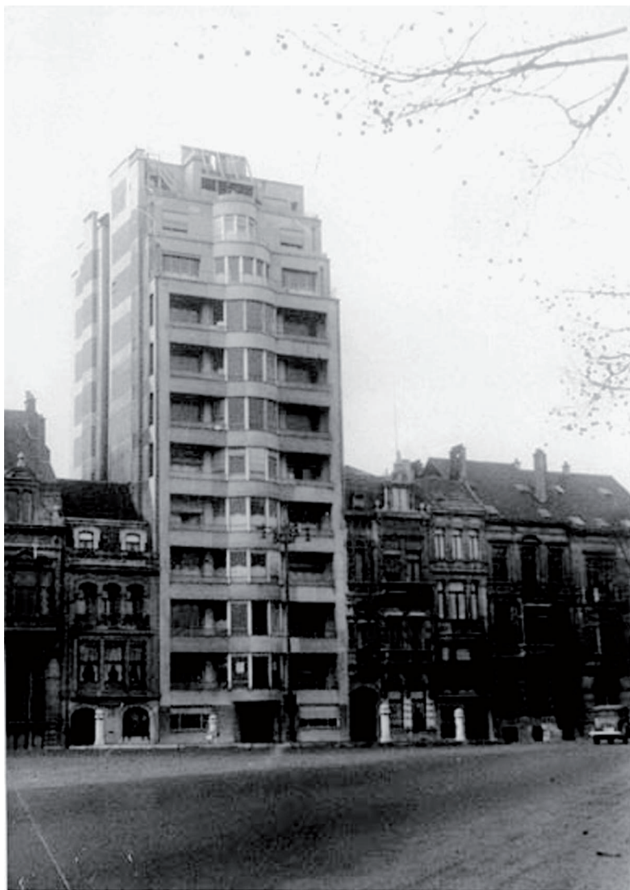
• Le quartier général de la Sipo-SD de Bruxelles, avenue Louise.