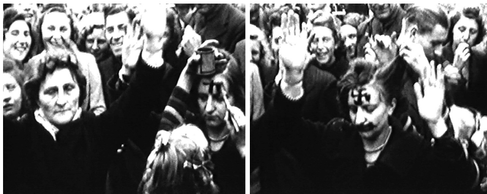
• Het “onvrouwelijk” maken van een collaboratie in geleidelijke stappen, Antwerpen, Vogelmarkt, september 1944. (VRT, De bevrijdingsdagen in het Antwerpse, september-oktober 1944)

Een film opgenomen in de septemberdagen van 1944 op de Vogelmarkt te Antwerpen toont de metamorfose van een iets oudere en een jonge, incivieke vrouw. Een grote menigte keek toe hoe men aan de transformatie van de twee collaboratrices begon. Terwijl men de haren van de oudere vrouw knipte, kreeg de jongere een hakenkruis op haar voorhoofd geschilderd. Vervolgens bewerkte een vaderlandslievende vrouw de haren van de jongste collaboratrice. Deze incivieke vrouw werd tevens een baardje opgeschilderd. Door dit mannelijk symbool werd de vrouw vermannelijkt. Ook dit droeg bij tot de deconstructie van haar zachte vrouwelijkheid. Nadat haar laatste haren verdwenen waren, mocht ze op de foto met Hitler 82 .