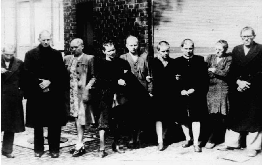
• Kaalgeschoren vrouwen en mannen in het West-Vlaamse Wervik, september 1944. Het is de enige aanduiding dat in Vlaanderen ook mannen deze straf ondergingen.

werden tentoongesteld op de erkertribune van de stadshallen 48 . Luc Schepens, in 1944 een zevenjarige Bruggeling, vermeldde in zijn boek dat jonge vrouwen kaal werden geschoren op de grote markt 49 . En Joseph Coppieters, een tijdgenoot, bevestigde deze gebeurtenissen in zijn dagboek 50 .