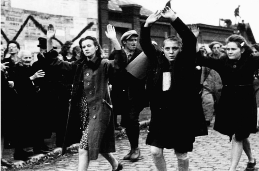
• Op 4 september 1944, de eerste dag van de bevrijding, wordt de rekening vereffend. Duitsgezinde vrouwen worden in Mont-sur-Marchienne bij Charleroi door leden van het verzet opgepakt, bij één van hen is het haar al afgeknipt.

Ook horizontale collaboratrices schoten tekort in hun traditionele, vrouwelijke taken. Vaderlandslievende vrouwen stonden in voor het voortbestaan van de natie. Immers, “zolang er vrouwen zijn die het moederschap als een zegen aanvaarden zal ons volk jong, krachtig en schoon zijn” 113 . Voorbeeldige vrouwen zorgden voor de reproductie en zo voor het overleven van de natie. Ze creëerden leven, nieuwe generaties voor de natie. Zeker in tijden van crisis stonden vrouwen zo garant voor continuïteit 114 . Horizontale collaboratrices kozen echter voor Duitse mannen. Zo brachten ze dit verder bestaan van de natie in gevaar. Het ging zelfs verder dan dat. Niet enkel ontnamen ze de eigen natie nieuwe generaties, maar schonken ze deze aan de bezetter. Door de keuze voor een Duitse man, droeg een horizontale collaboratrice bij tot het overleven van de vijandige natie. Zo schoot de ‘onvaderlandse’ vrouw tekort in haar taak van het bewaren van de nationale en etnische grenzen 115 . Door de horizontale collaboratie verdween de grens