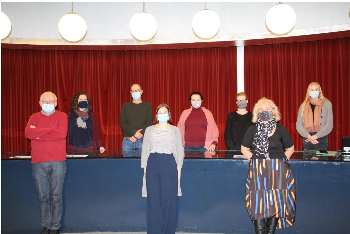
Presentatie van lopende projecten - CegeSoma - 19 oktober 2020

Op 19 oktober 2020, kwam een groot deel van het team samen in de conferentiezaal voor de presentatie van 'lopende projecten', met respect voor alle veiligheidsmaatregelen. We ontmoetten soms voor het eerst nieuwe collega's die we nog niet lijfelijk hadden kunnen zien.