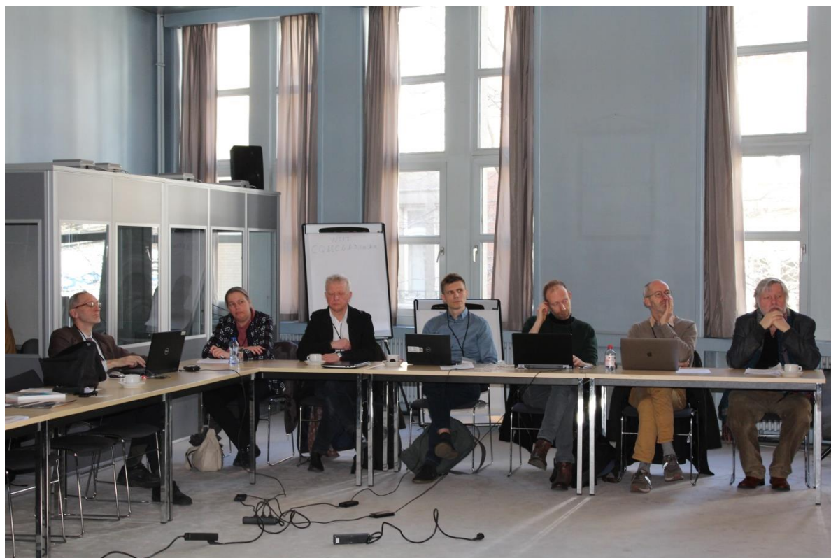
Workshop ' Cultures of Spectacle in Occupied Belgium : Parallels (1914-1945) ' - CegeSoma - 12 & 13 maart 2020