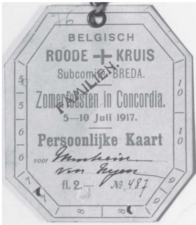
Persoonlijk lidkaart uitgegeven door het subcomité Bredavan het Belgische Rode Kruis, 1917. (CEGESOMA, nr. 530796)

zijn vaak geschreven vanuit regionaal of lokaal perspectief. Recente werken zijn in het algemeen van hogere kwaliteit.