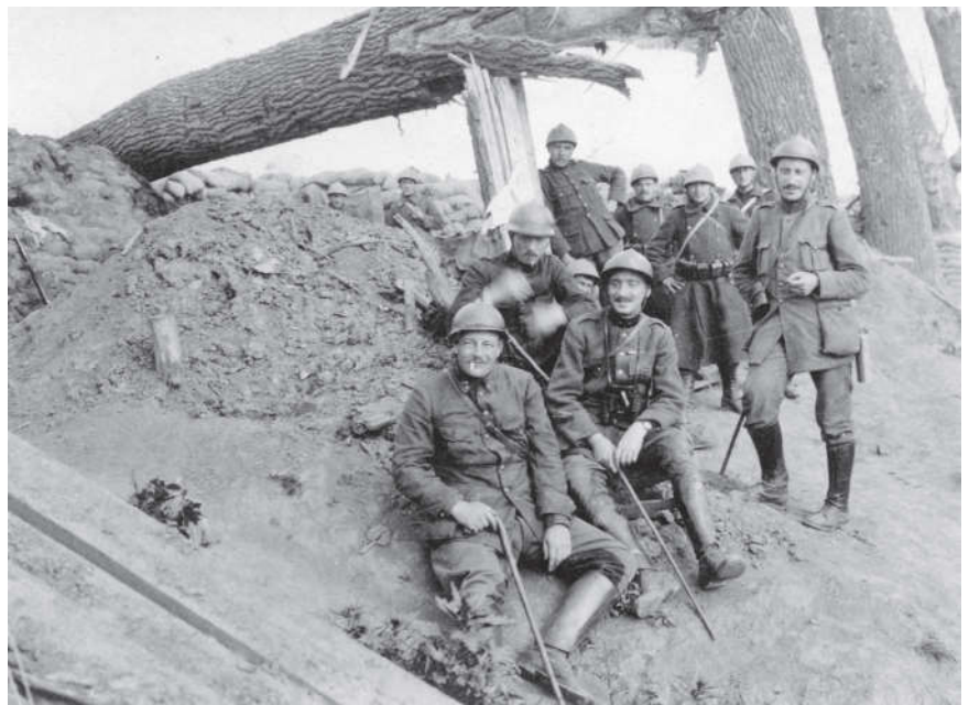
Belgische soldaten in een loopgraaf, 1916.

Enkele kleinere verzamelingen geven ons inzicht in andere aspecten van de periode 1914-1918: het politieke leven, sociale toestanden en de economie in oorlogstijd. De 475 foto's van Janine Binon brengen een getuigenis van het leven van verpleegsters in het hospitaal 'L'Océan' in De Panne en de school 'Koningin Marie-José' in Wulveringem.