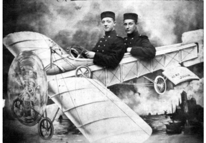
"Familiefoto in de tijd van de Eerste Wereldoorlog".