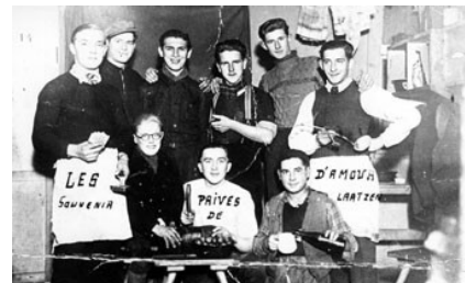
Dwangarbeiders in Duitsland tijdens de Tweede Wereldoorlog. Het bijschrift "Les privés d'amour. Souvenir de Laatzén", is veelzeggend.