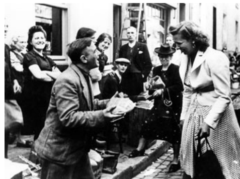
Jonge vrouw koopt brood op zwarte markt. België, 1943. (CegeSoma, nr 28437)