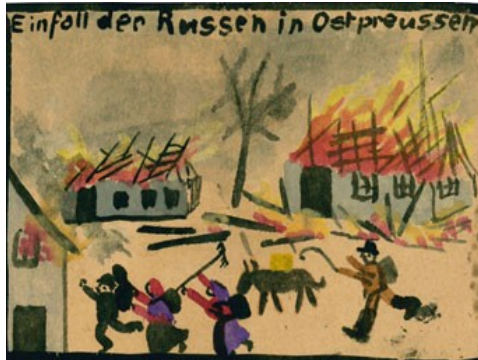
Franz Przybyla, geboren in Dresden in 1904, maakt tekeningen van de belangrijkste oorlogsgebeurtenissen.

Veel meer dan vroeger zijn kinderen nu zowel middel als doelwit van de oorlogspropaganda. Op alle mogelijke manieren worden ze ingezet om bij te dragen aan de oorlogsspanningen. Op het eerste gezicht onschuldige kanalen zoals literatuur, speelgoed en kleurboeken brengen hen de zin van de oorlog bij. Sommigen dromen er zelfs van om mee te kunnen vechten aan het front.