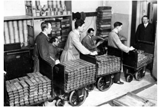
Nationale Bank van België – transport van goud (32 miljoen BFR).

De Belgische economie heeft de voorbije eeuw een gedaanteverandering ondergaan. Voor de Eerste Wereldoorlog was zij een innovatieve, agressief liberale wereldmacht. Daar schoot in 1918 maar weinig meer van over. België hield aan de oorlog een sociaaleconomisch trauma over. In de daaropvolgende decennia probeerde het land dat te verwerken door zich in te kapselen: in economische automatismen als de index, in sociale overlegstructuren en een sociale zekerheid, maar ook in een pacificatiepolitiek en in internationale samenwerkingsverbanden. Die buffers moesten een nieuwe catastrofe voorkomen. Tegelijkertijd werd België zo ook een land waar sociaaleconomische verandering maar schoorvoetend kon gebeuren. Honderd jaar later kampt het kleine, open land nog steeds met de effecten van dat trauma. Is België gestold ?