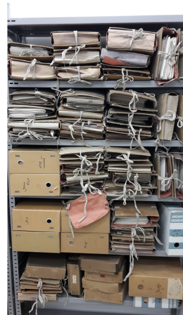
Foto's in hun oorspronkelijke mappen voor het herverpakken door het CegeSoma