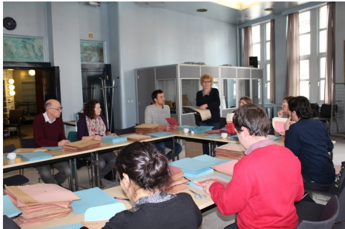
Een collectief ‘herverpakkingsmoment’ – CegeSoma - 12.3.2018

De belangrijkste nieuwe aanwinst was de twee strekkende meter van het archief van de verbroedering van de sabotagedienst Hotton ( la Fraternelle du service de sabotage Hotton ), een fonds dat vooral bestaat uit de naoorlogse persoonlijke erkenningsdossiers. In 2018 werden 1188 nieuwe boektitels toegevoegd aan de bibliotheekcollectie van het CegeSoma (tegenover 921 nieuwe titels in 2017). Het abonnementenbestand van tijdschriften ging naar 33 (104 ruil-uitwisselingen).