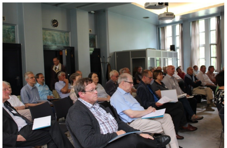
Dag voor de Franstalige heemkundige kringen – CegeSoma - 11.6.2018