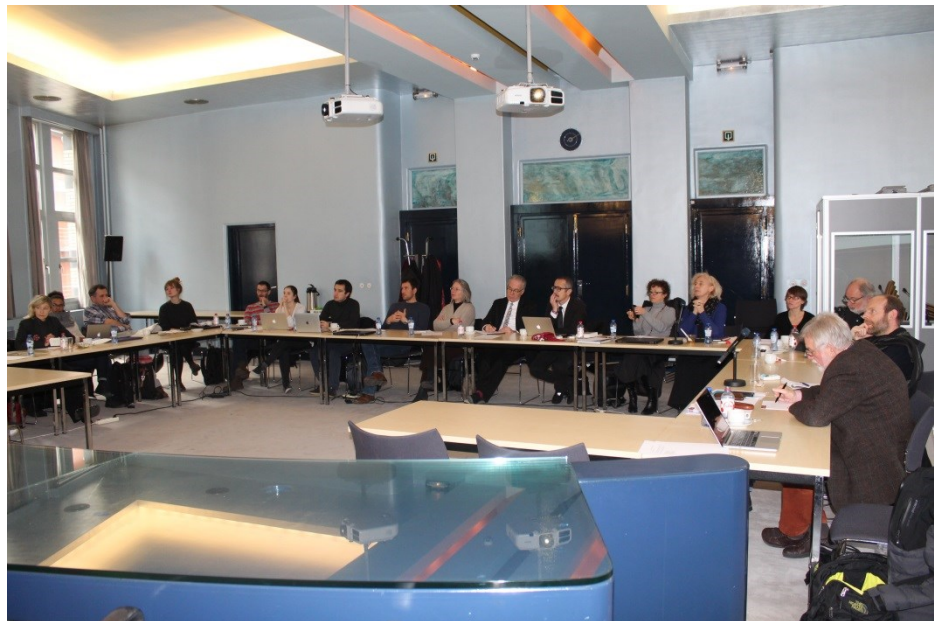
Internationale Workshop : het einde van de projecten GWB & Memex – CegeSoma – 14.12.2018

De eindrapporten van beide projecten tonen alvast een zeer eerbiedwaardige output via wetenschappelijke publicaties, maar toch verwachten we in 2019 nog belangrijke resultaten in de vorm van de diverse doctoraatsonderzoek en die nog niet werden afgerond.