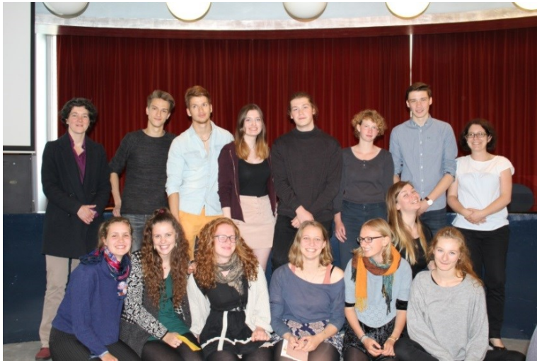
Afsluitend evenement ASF - CegeSoma - 19.6.2018

ASF werd na WO II opgericht met als doel jonge Duitse vrijwilligers uit te sturen naar landen waar de bevolking tijdens de Tweede Wereldoorlog geleden heeft onder de misdaden van de nazi's. Deze Duitse jongeren engageren zich daar in sociale, culturele, educatieve of historische projecten. Het CegeSoma fungeert sinds 2009 als gastinstelling en op 19 juni ontvingen we in onze conferentiezaal alle vrijwilligers die in het academiejaar 2017-2018 in België gewerkt hebben in het nationale afsluitende evenement