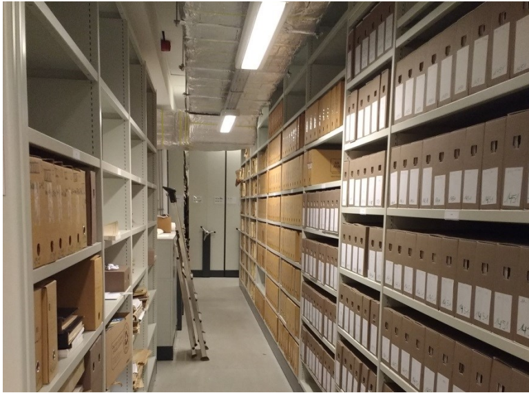
Het Belgradodepot te Vorst- 2018

Met de vliegende start die hij nam in 2018, onder meer ook met de voorbereiding van een grote bestandscontrole in het Belgradodepot (eind 2018) en in de Luchtvaartsquare (januari 2019), is een belangrijke basis gelegd voor het professionaliseren – en dus deels reorganiseren – van het collectiebeleid in ruime zin.