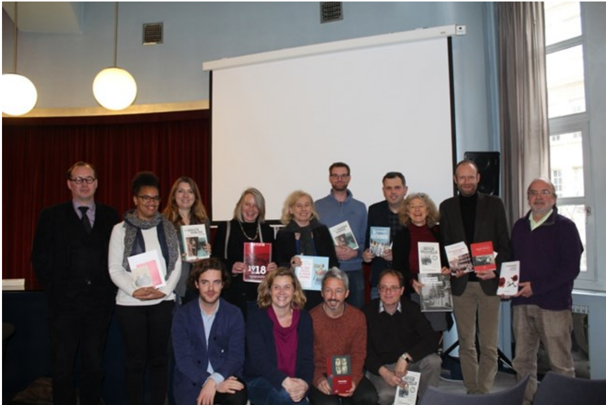
Publicaties over de Grote Oorlog aan het eind van de herdenkingen. Balans en vooruitzichten - CegeSoma - 19.11.2018

het Rijksarchief betrokken was. Er werden negen belangrijke publicaties voorgesteld door hun auteurs.