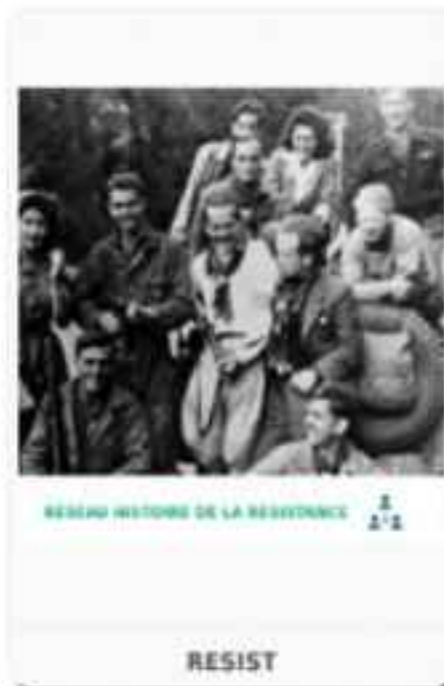
RESEAU HISTORIQUE DE LA RESISTANCE